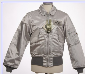
CWV45 MP Tex Made in USA